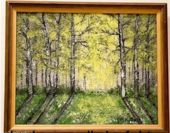
akryl na podłożu fakturowanym - wiosna